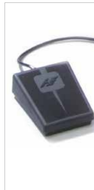
1 Артикул 443.0755.0