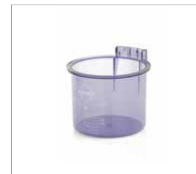
2 Артикул 340.0050.0