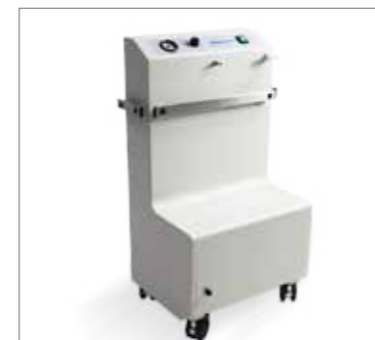
1 Артикул 443.0700.0