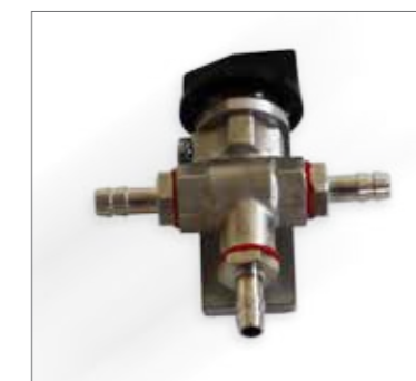
9 Артикул 340.0096.0