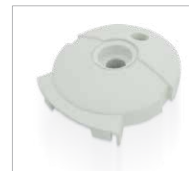
6 Артикул 340.0053.0