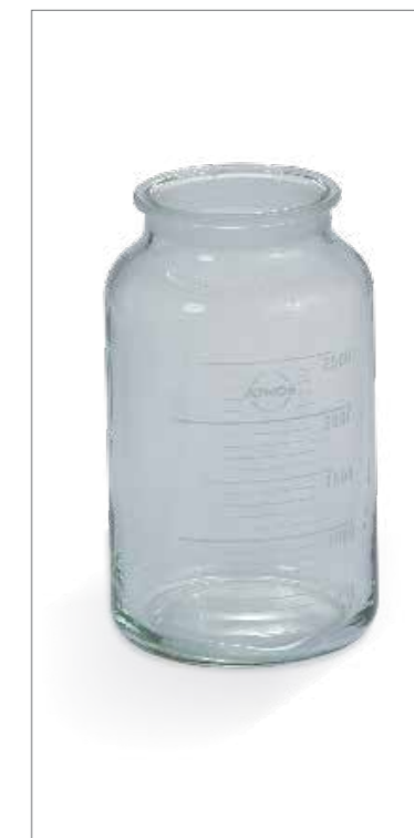
6 Артикул 444.0033.0