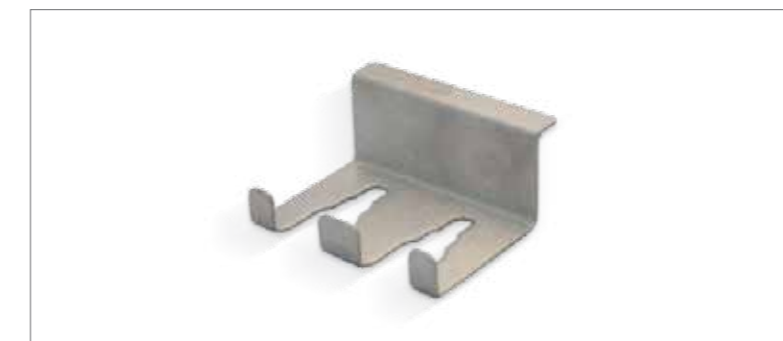
3 Артикул 320.0611.0