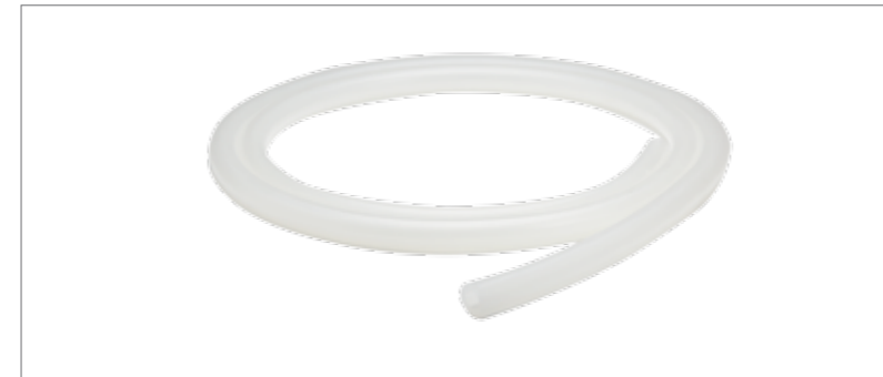
1 Артикул 000.0243.0