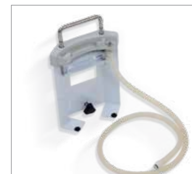
2 Артикул 320.0640.0