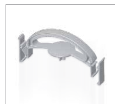
7 Артикул 340.0055.0