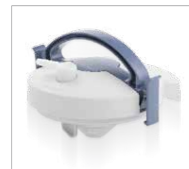
5 Артикул 340.0040.0