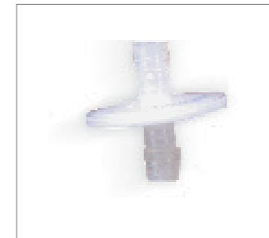
6 Артикул 443.0738.0