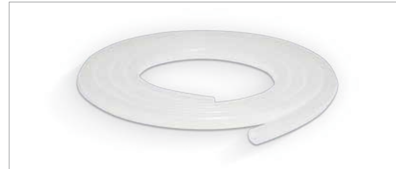
2 Артикул 000.0361.0