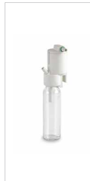
8 Артикул 444.0646.1