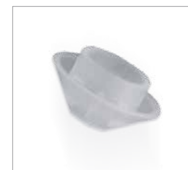
9 Артикул 340.0056.0