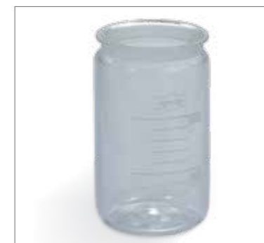
5 Артикул 444.0032.0