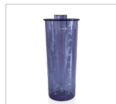
4 Артикул 340.0052.0