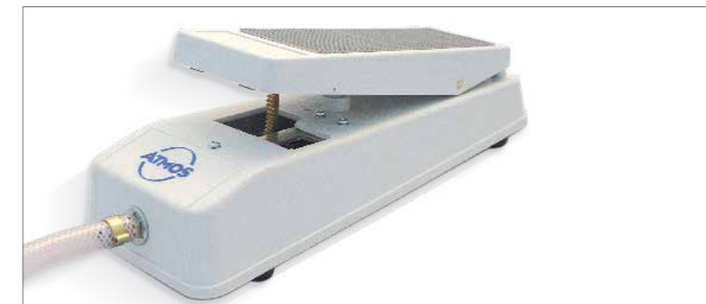
2 Артикул 443.0770.0