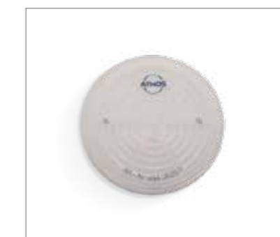
7 Артикул 444.0628.0