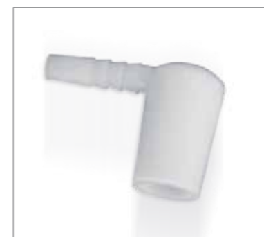
10 Артикул 340.0057.0