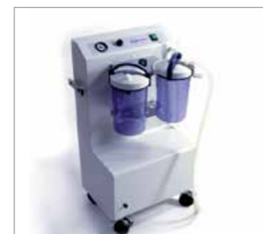
1 Артикул 444.0930.0