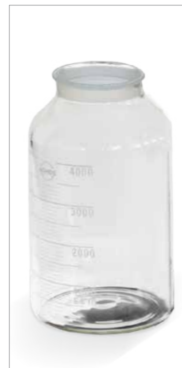
7 Артикул 444.0034.0