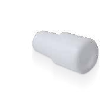
12 Артикул 340.0062.0