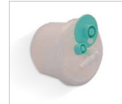
4 Артикул 340.0061.0