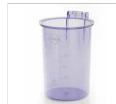
3 Артикул 340.0051.0