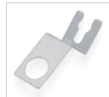
11 Артикул 340.0066.0