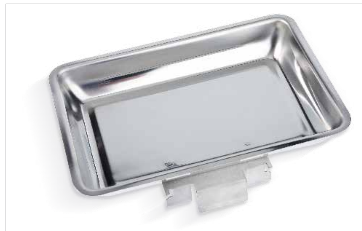
4 Артикул 443.0790.0