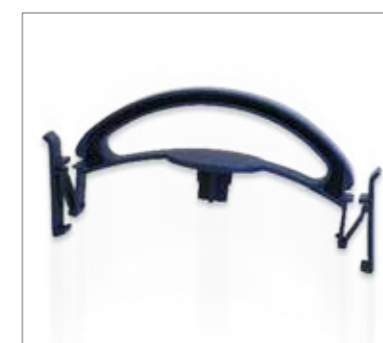
8 Артикул 340.0326.0