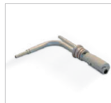
4 Артикул 444.0640.0