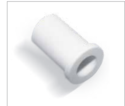
3 Артикул 340.0054.0