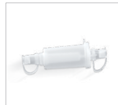
5 Артикул 401.0555.0