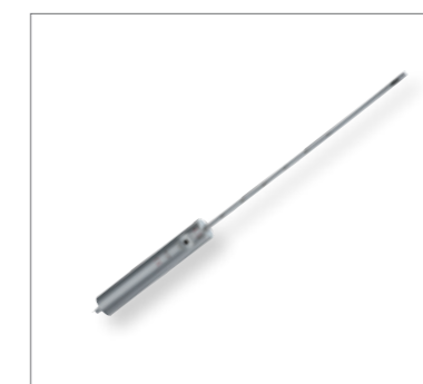
6 Артикул 404.0193.0