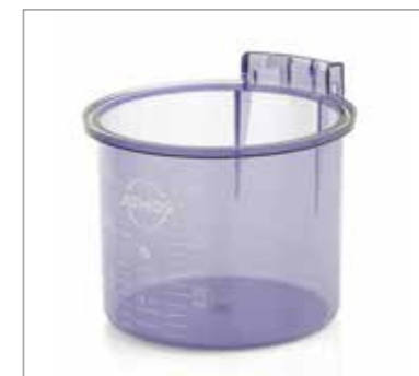
2 Артикул 340.0050.0