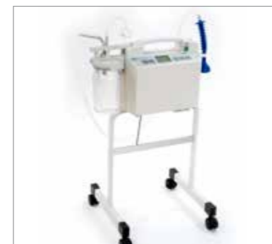
1 Артикул 444.0481.0