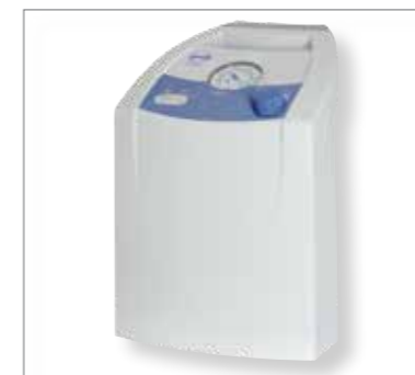
2 Артикул 340.0300.0