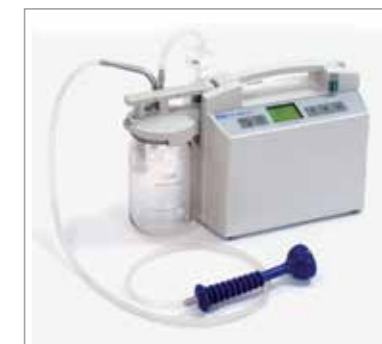
3 Артикул 444.0490.0