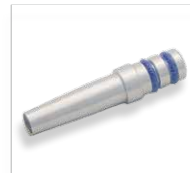
5 Артикул 444.0013.1