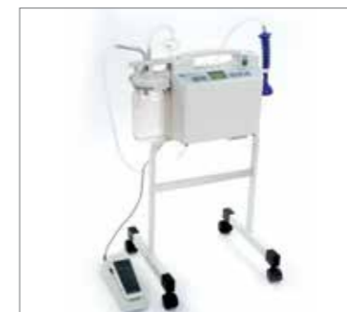
2 Артикул 444.0482.0