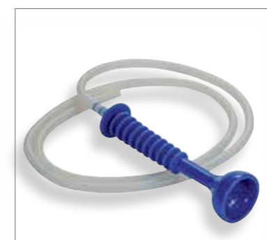
5 Артикул 404.0193.0