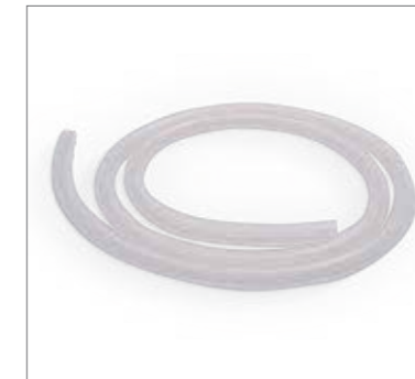
3 Артикул 000.0013.0