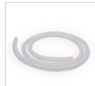
2 Артикул 000.0013.0