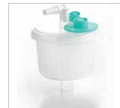
3 Артикул 340.0061.0