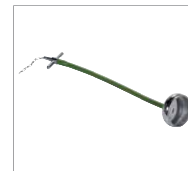
3 Артикул 404.0157.0