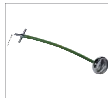
1 Артикул 404.0155.0