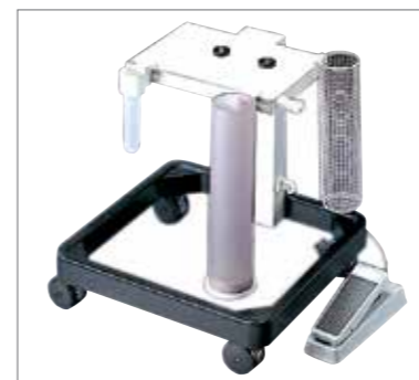
1 Артикул 444.0020.0