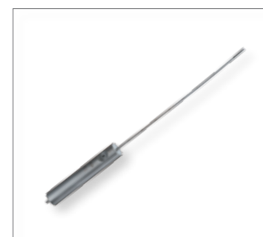
7 Артикул 401.0554.0