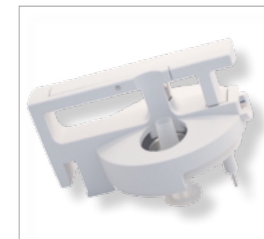
3 Артикул 444.0015.0