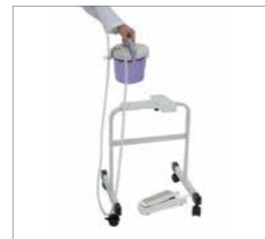
1 Артикул 340.0035.0