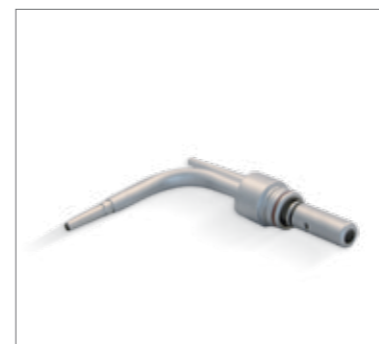
4 Артикул 444.0012.0