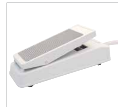
2 Артикул 444.0452.0