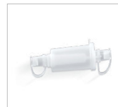
4 Артикул 401.0555.0