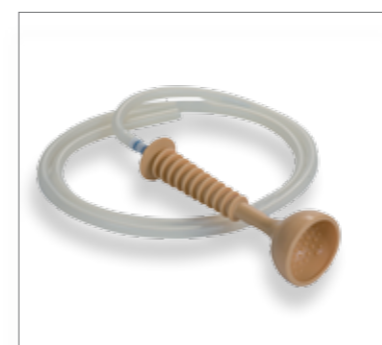
4 Артикул 404.0194.0