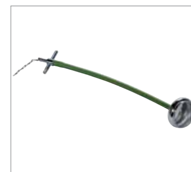
2 Артикул 404.0156.0