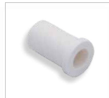
1 Артикул 340.0054.0