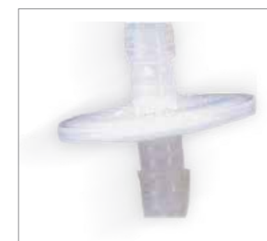
5 Артикул 443.0738.0