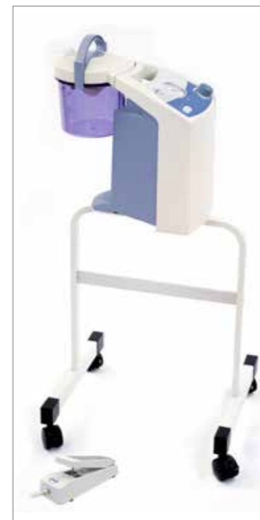
1 Артикул 340.0355.0