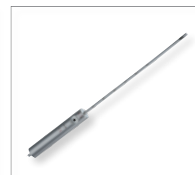
8 Артикул 401.0528.0