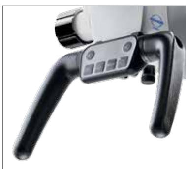
8 Поперечный двойной захват