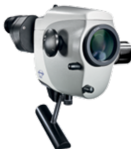
ATMOS ® iView 31