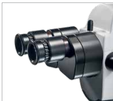
1 Прямой бинокулярный тубус