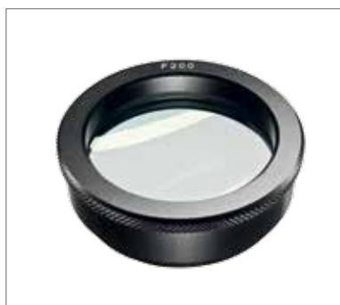
4 Объектив (200/250/300/400 мм)