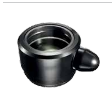
3 Объектив с ручной фокусировкой (200/250/300/400 мм)