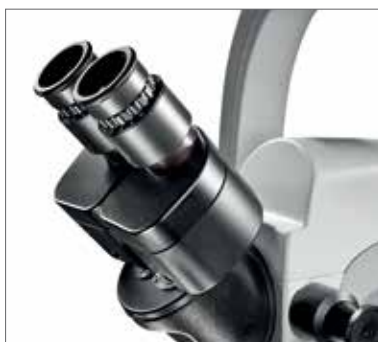
2 Бинокулярный угловой тубус