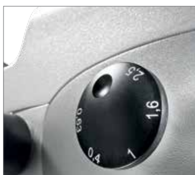
7 Переключатель увеличения