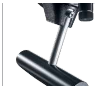
9 Т-образный захват