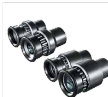
6 Широугольные окуляры 10 x Широугольные окуляры 16 x