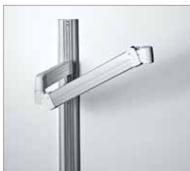
10 Настенный штатив