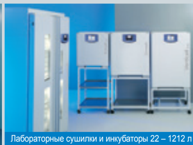
Лабораторные сушилки и инкубаторы 22 – 1212 л