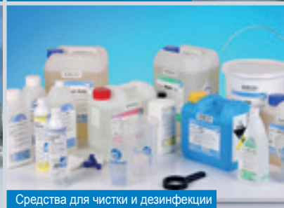
Средства для чистки и дезинфекции