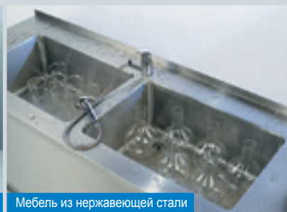
Мебель из нержавеющей стали