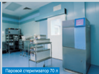
Паровой стерилизатор 70 л