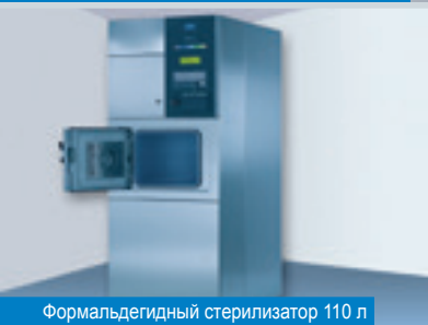
Формальдегидный стерилизатор 110 л