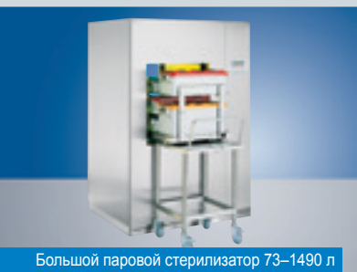
Большой паровой стерилизатор 73–1490 л