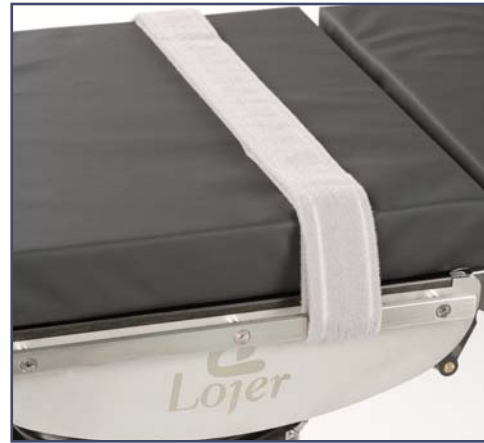
Мягкий ремень для фиксации пациента на липучке, код R7842