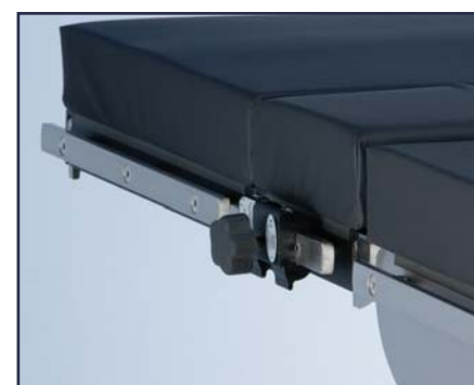
Зажим для принадлежностей с плоским клинком, код 60200