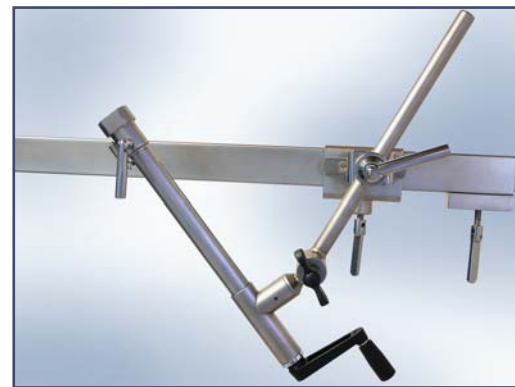
Тракторный механизм для ортопедической приставки. Код 60291