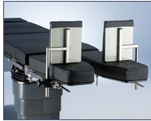
Упор для голеностопа, пара, код 7510175