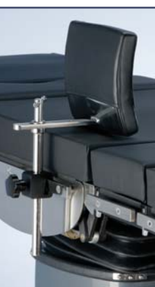
Боковой упор широкий, код 514614166