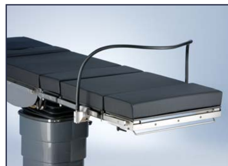
Анестезиологический экран гибкий, включая зажим, код 10311