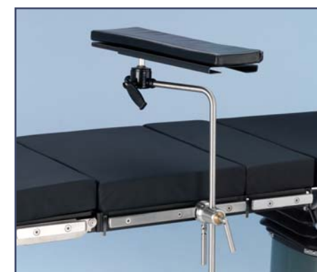
Многофункциональный столик для руки с функцией горизонтального перемещения платформы на 15 см., код 60322