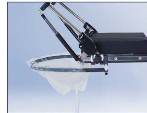
Система мочеприема Uro Catcher (код 60324). Гибкая рамка позволяет хирургу свободно и беспрепятственно приближаться к пациенту. Рамка легко возвращается в первоначальное положение. Система совместима со всеми современными отсосами. В комплекте с 10-ью стерильными пакетами, код 60235