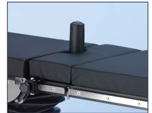
Промежный валик, код 60115. Требуется зажим 61264