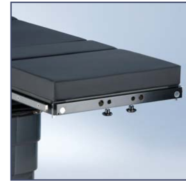
Адаптер для специальных головных секций по Майфильду, код 60110