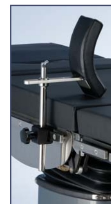
Боковой упор узкий, код 61406