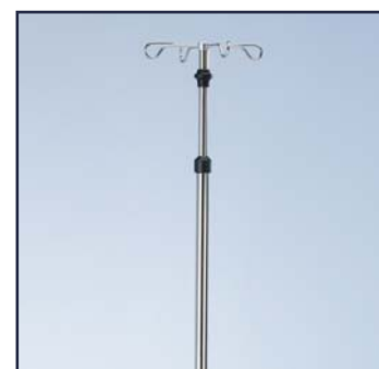
Инфузионная стойка Ø18 мм., из нержавеющей стали. Регулировка по высоте одной рукой, код 60120. Мобильная инфузионная стойка из нержавеющей стали, 5 колес по 80 мм. Регулировка по высоте одной рукой, код 60130