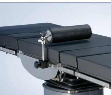
Горизонтальный валик 10369