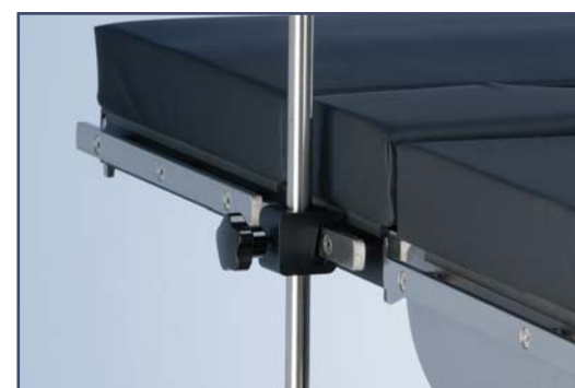
Зажим стандартный, алюминий, код 61264