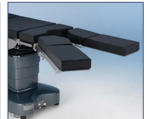
Разделенная двойная ножная секция, код 60161