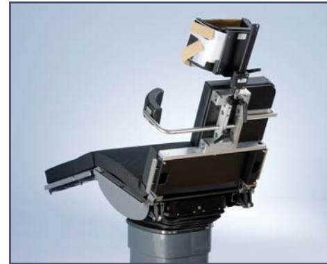
Боковой упор для операций на плече, код 602801