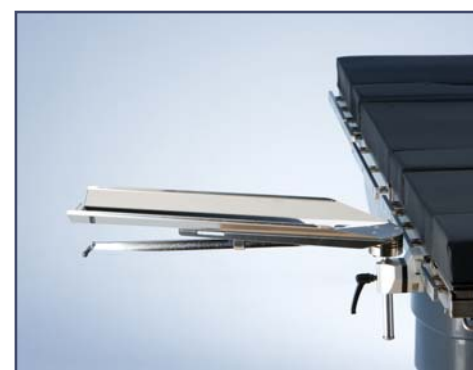
Опора для руки, включая зажим, без подушки, код 10380. Модель 6010387 (без подушки, включая зажим) имеет функцию ротации.