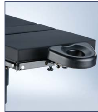
Гибкая головная секция для ЛОР, пластических и офтальмологических операций, код 60327, необходим адаптер 60110