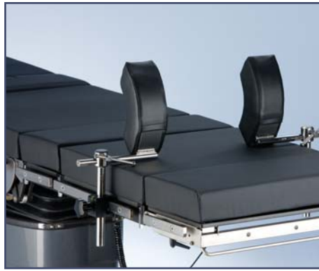
Упор для плеча, пара, код 61253