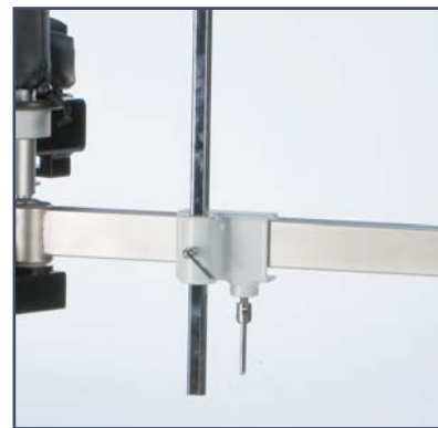
Зажим для ортопедической приставки, код ES106