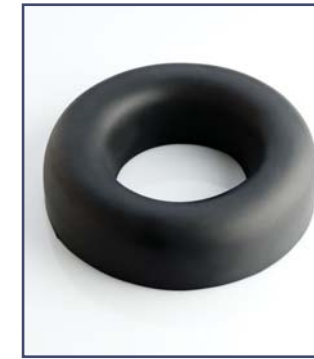
Круглая подушка под голову, код 10333