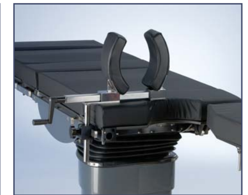
Держатель ноги при артроскопии, код 6128920