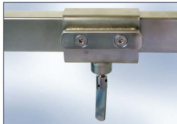
Расширяющий рельс для крепления аксессуаров к ортопедической приставке, код ES15334