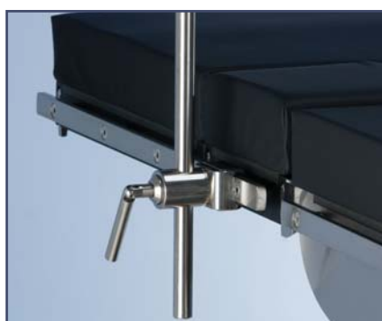
Зажим ротационный, нержавеющая сталь, код 61283