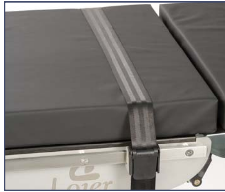
Ремень для ноги, пара, включая зажим, код 10372