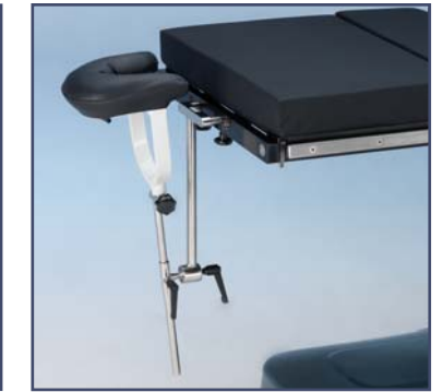
Головная секция для нейрохирургии, код 6010335, необходим адаптер 60110