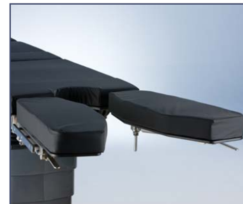
Раздельная ножная секция, пара, код 60160