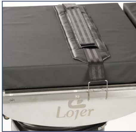
Мягкий ремень для фиксации пациента, код 10464