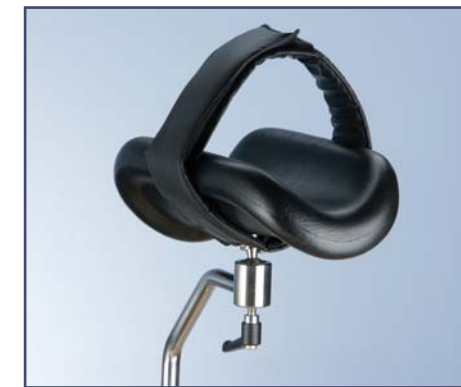
Ремни для крепления ног, код 10452