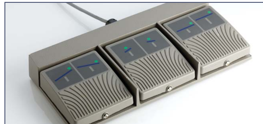
Ножной пульт управления, три программируемые функции, код 60270