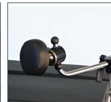
Боковой упор круглый, вращающийся, код 603211, требуется зажим 60200