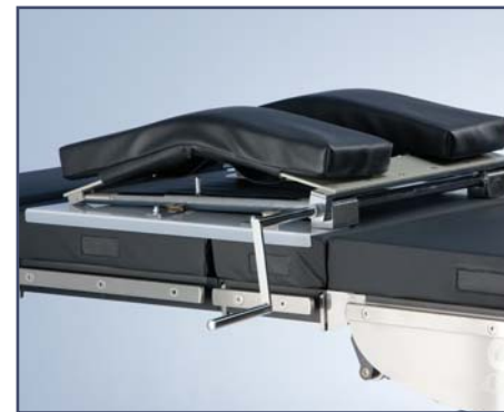
Приставка для ламинэктомии, две подушки с абдоминальным вырезом, ручная регулировка, код 6010485