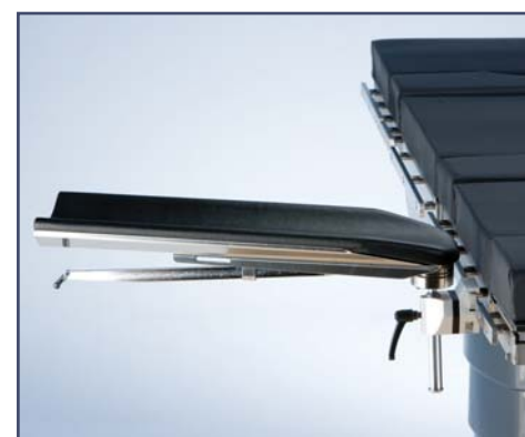
Вогнутая подушка для опоры для руки, литая код 10382