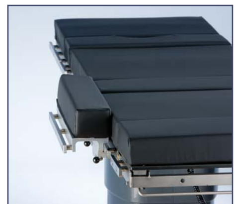
Дополнительные расширяющие боковые секции (пара, включая зажимы и матрацы), длина 500 мм. Код 10423