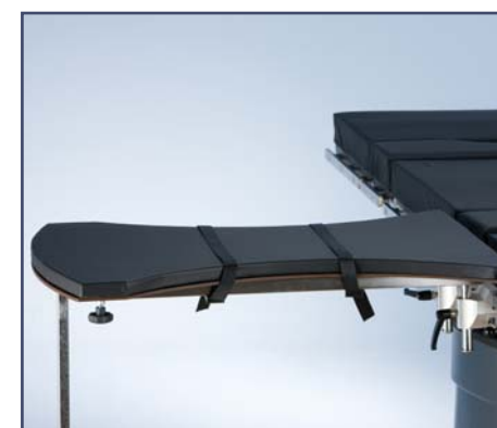
Столик для операций на руке со складывающейся опорной ножкой, включая зажим, код 10390