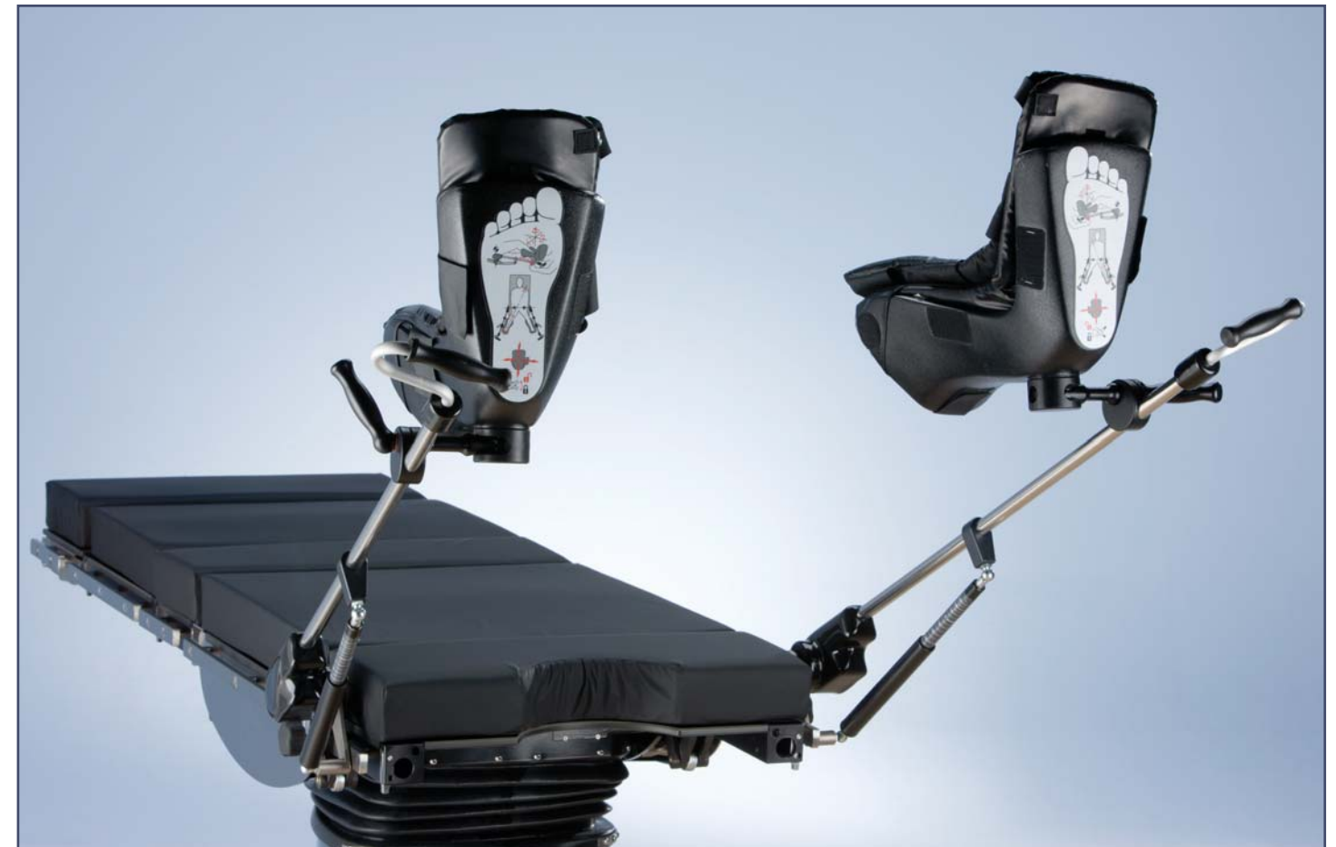
Опоры для ног с возможностью 3D движения, пара. Позволяют провести легкое позиционирование пациента (абдукцию) при литотомии, поддерживая стерильную зону. Код 60320. Необходимы зажимы 60200.