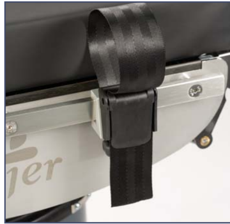
Ремень для запястья, включая зажим, код 10370