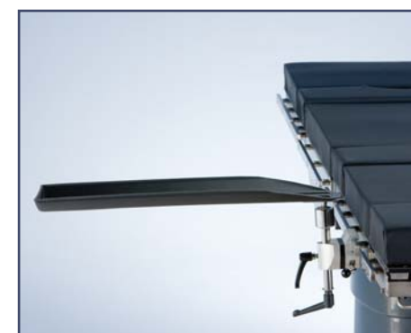
Рентгенпрозрачная опора для руки, включая зажим, код 10385