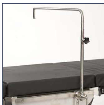
Анестезиологический экран, включая зажим, код 10310. Расширяющая часть (опция), код 60328