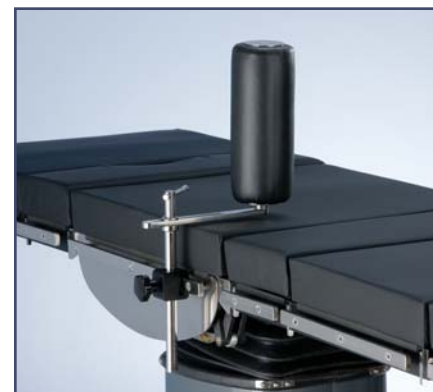
Вертикальный валик, код 61421