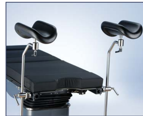
Подколенники, пара. Код 10450