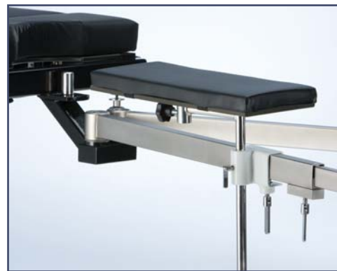
Платформа для ноги с подушкой, код 61120110