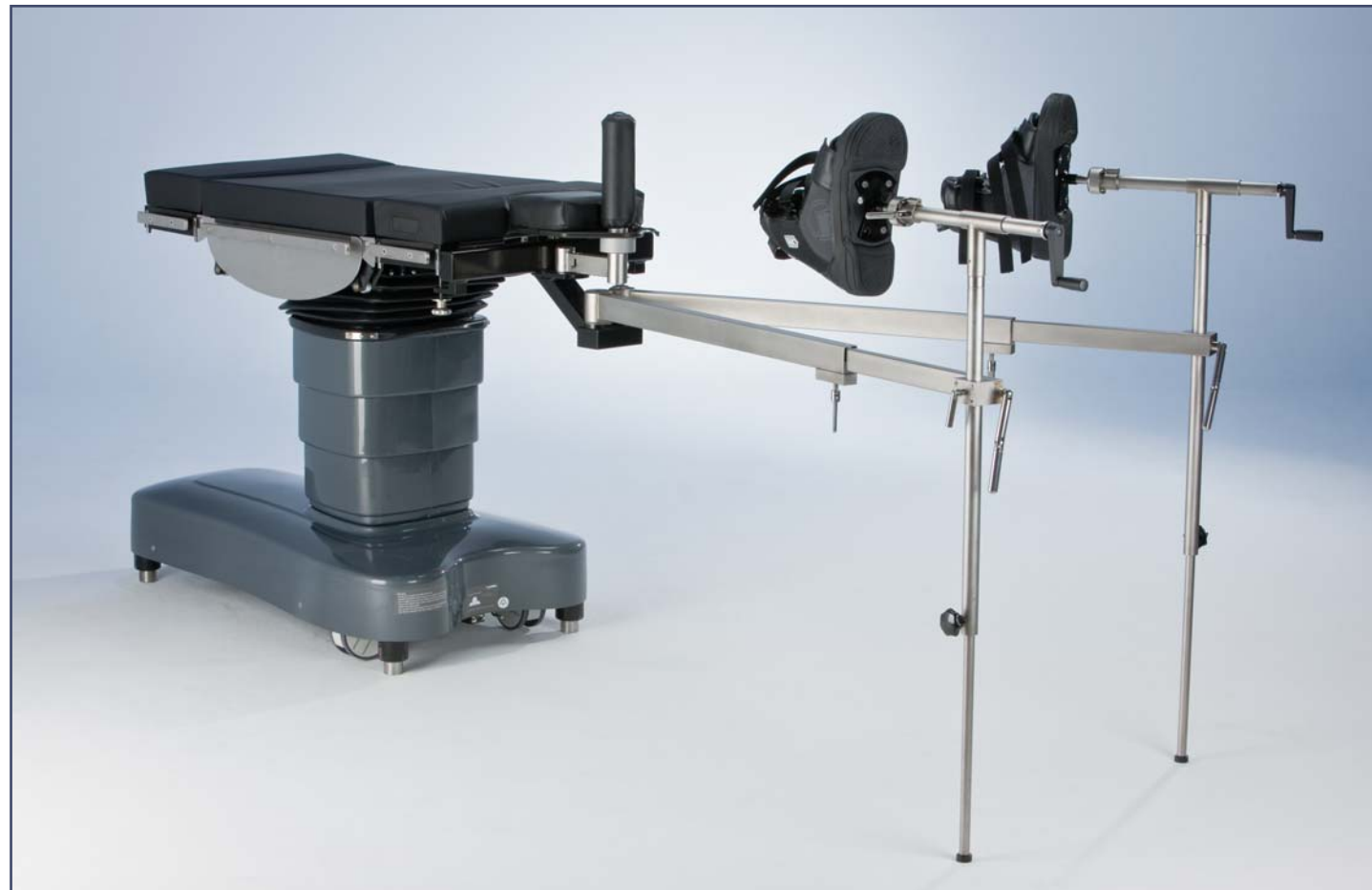
Ортопедическая приставка для проведения операций на нижних конечностях. Код 60290