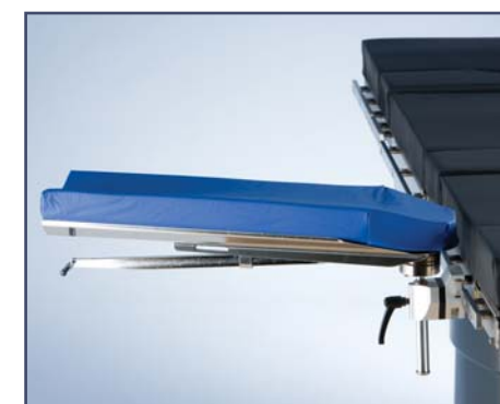
Вогнутая подушка для опоры для руки, код 10382H