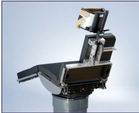
Модуль для операции на плече. Электропривод положения. Съемные боковые части. Головная секция с функцией 3D движения. Код 60280