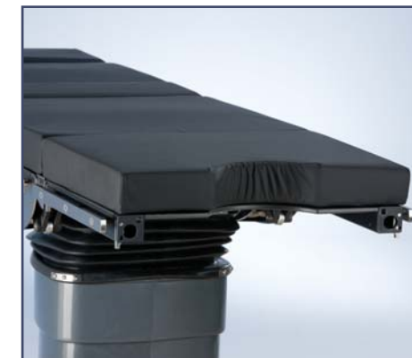
Гинекологическая/урологическая секция шириной 400 мм. (соединение мама/мама). Код 60150