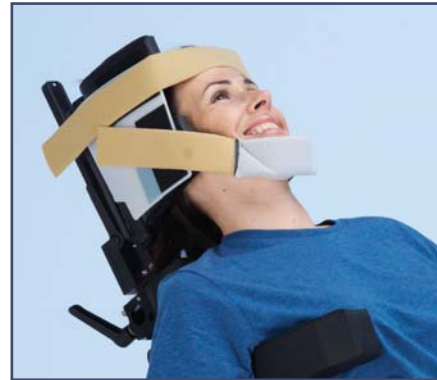
Ремни для крепления головы (12 шт. в упаковке). Код 602804