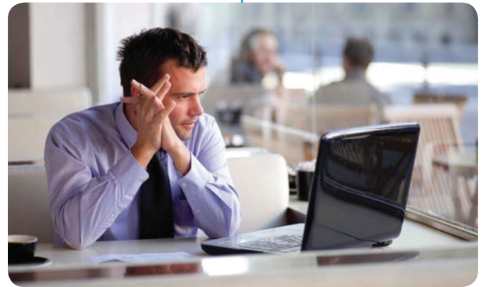
Эксперт за своим персональным компьютером