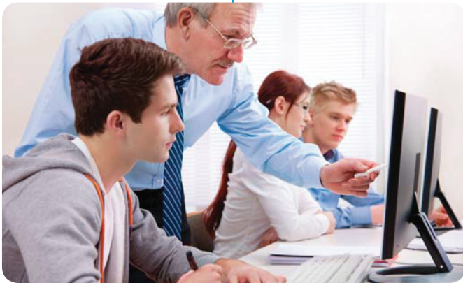
Удаленный центр обучения

На больничном сервере организуется единая база данных MS SQL для систем Vision Hema®. Vision Hema® Remote предоставляет локальным или удаленным пользователям доступ к анализируемым слайдам, используя защищенный канал.